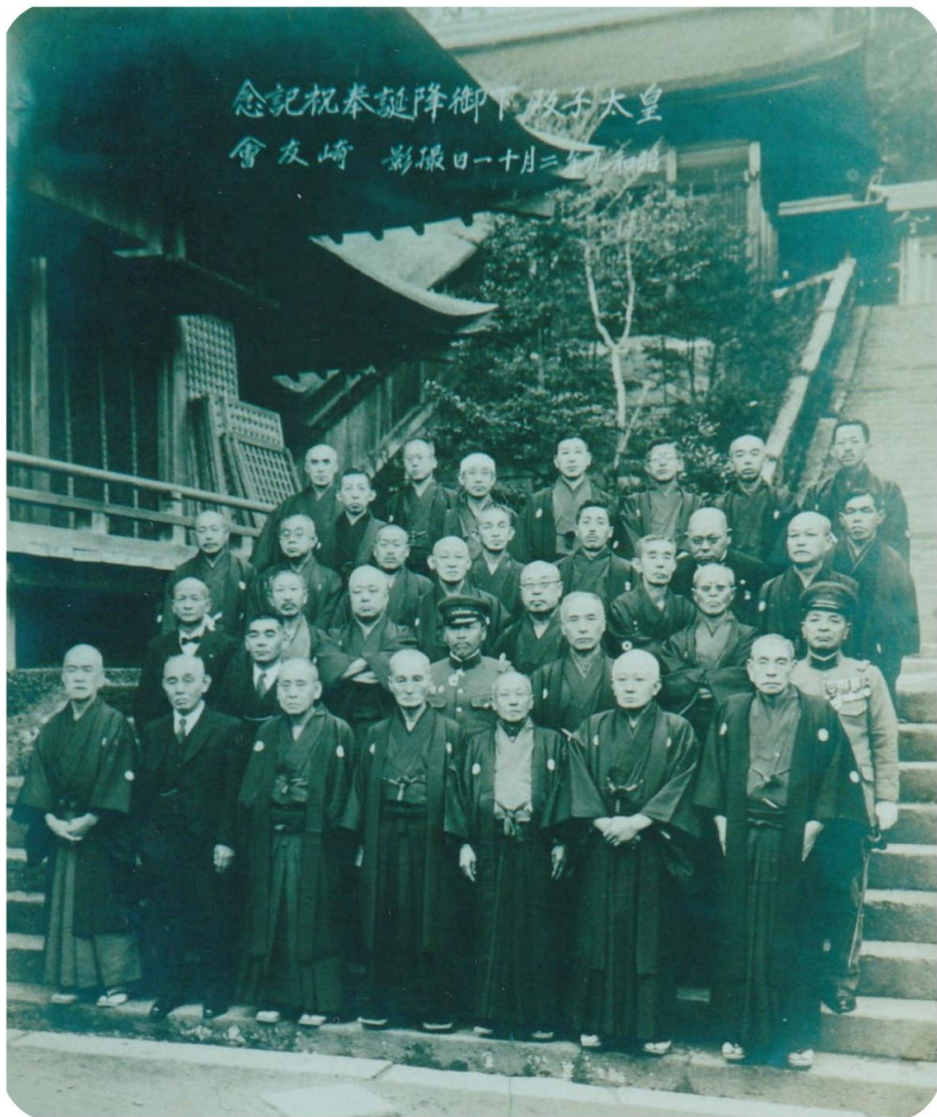
鎮西大社 諏訪神社